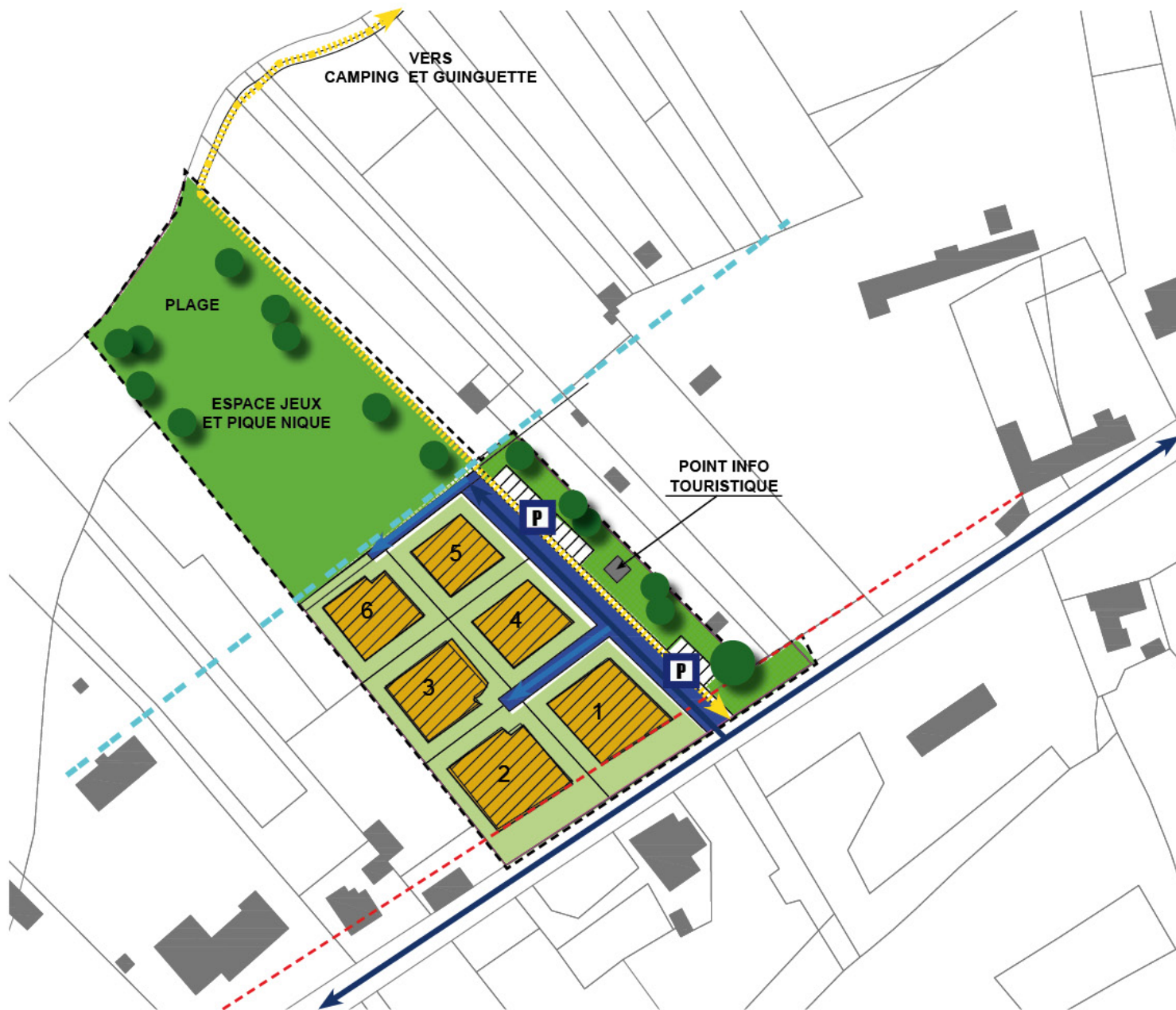
Schéma de principe d'urbanisation